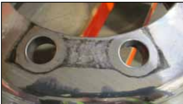
Galvanische Korrosion Auflageflächen Mutternschutzringe oder -abdeckung