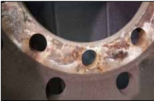
Galvanische Korrosion an den Auflageflächen des Rades