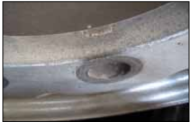
Galvanische Korrosion im Radmutterbereich und innen an der Zentralbohrung