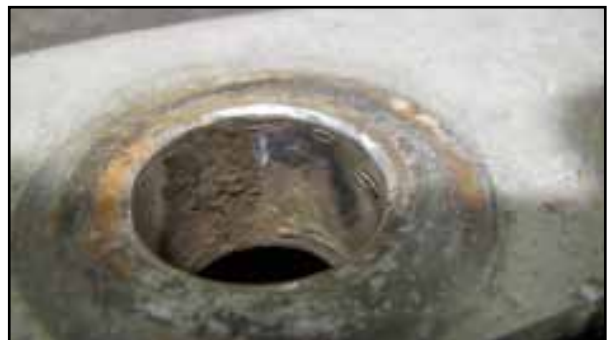
Galvanische Korrosion Radmutterbereich

Korrosion kann jedes Metall schwächen und somit Schäden und Risse verursachen. Unangemessene Wartung kann die Lebensdauer Ihrer Räder, Naben und anderen Materialien verkürzen.