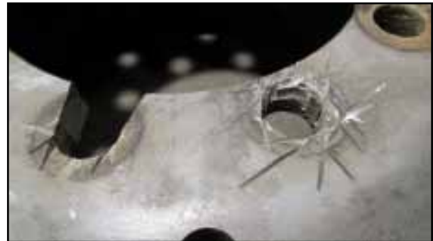
müssen Radmuttern aus dem Rad geschnitten werden.

Weitere Informationen über Radwartung finden Sie unter Serviceanleitung für Alcoa-Räder: