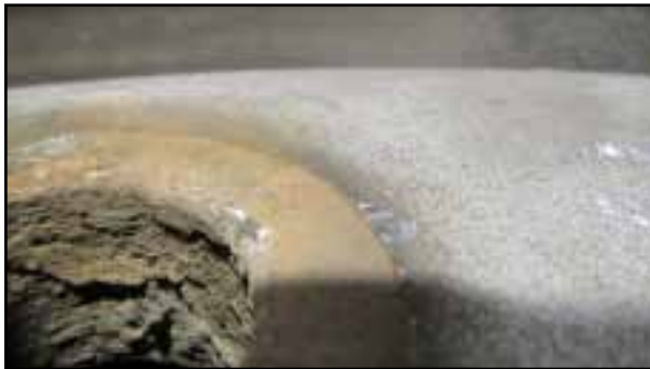
Ohne angemessene Fettung/Schmierung ....